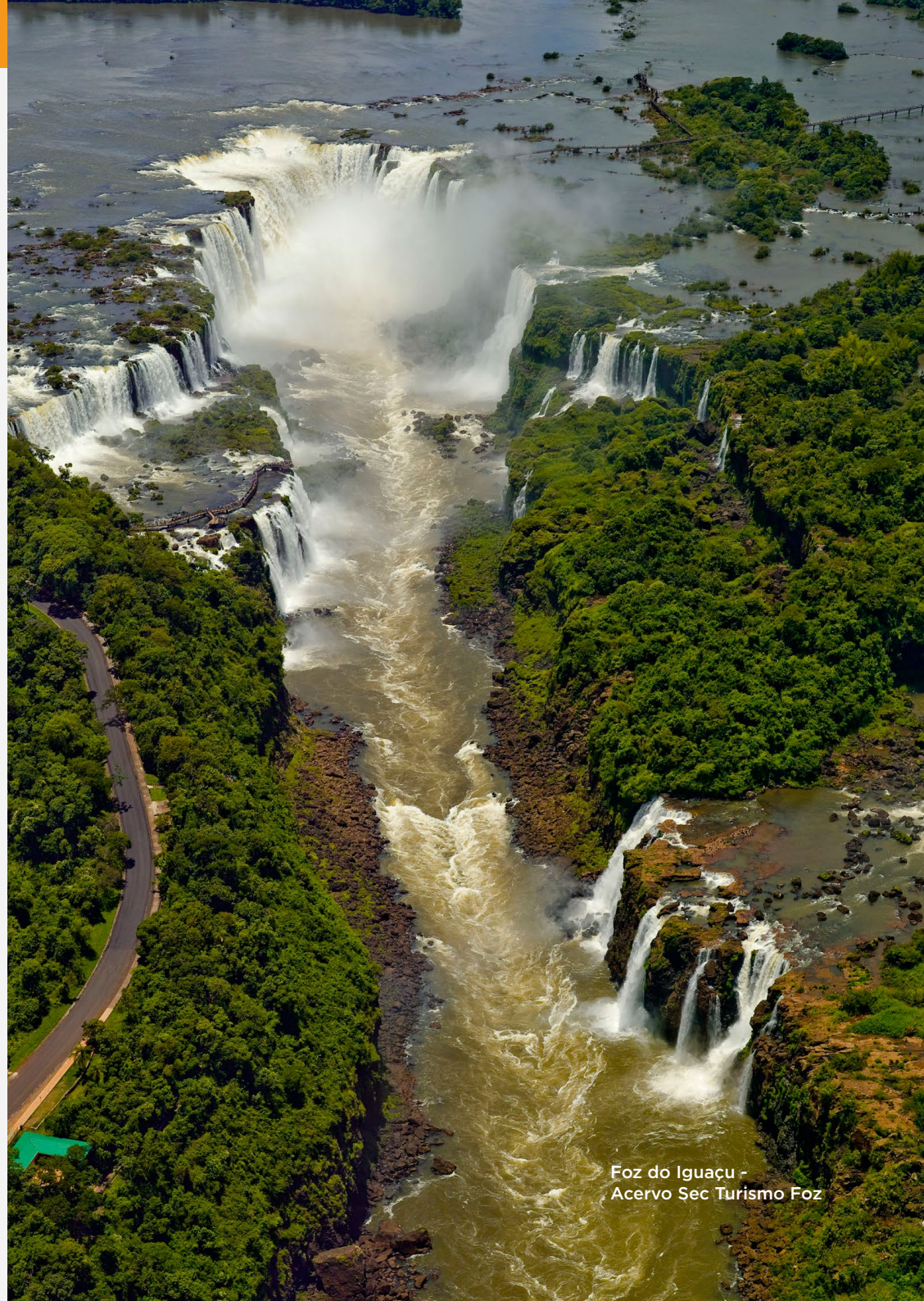
Foz do Iguaçu

Esta cartilha é um material complementar ao curso presencial que será realizado em parceria com a Instância Governamental Regional Vales do Iguaçu (IGR). Esperamos que esta cartilha desperte o seu interesse e que você aproveite ao máximo esta oportunidade de aprendizado. Bons estudos!