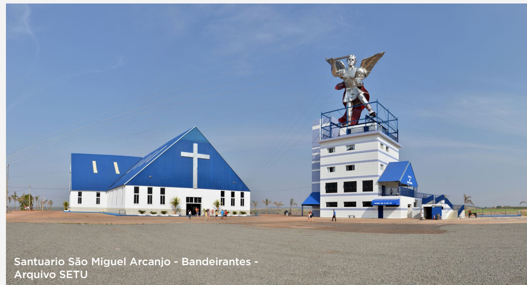
Santuário São Miguel Arcanjo - Bandeirantes

Na região Vales do Iguaçu existe um roteiro turístico chamado “Rota Religiosa”. Esse roteiro contempla 22 municípios, diversos locais e eventos, que contam a história da região através dos espaços de fé.