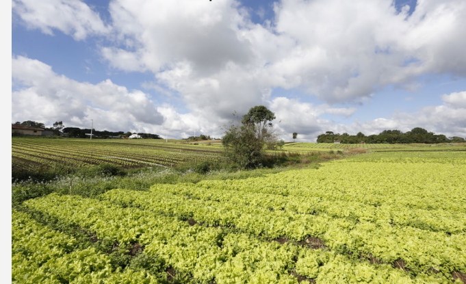
São José dos Pinhais

Em Chopinzinho, temos um exemplo deste tipo de atividade. É possível visitar a fazenda que produz os produtos do Irmão Queijeiro e L&G Alimentos, podendo até contar com a degustação de um café colonial, mediante agendamento.