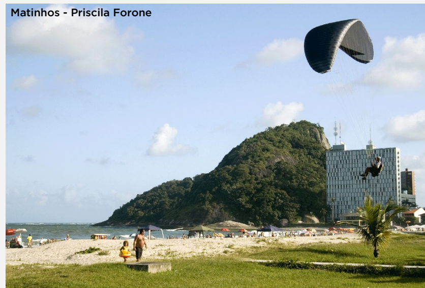
Matinhos - Priscila Forone

Tours e excursões: Participar de tours e excursões guiadas é uma maneira interessante de conhecer os pontos turísticos e a cultura de um destino. Pode ser um passeio de bicicleta pela cidade, uma visita a monumentos históricos, um tour gastronômico ou um passeio de barco para explorar a costa.