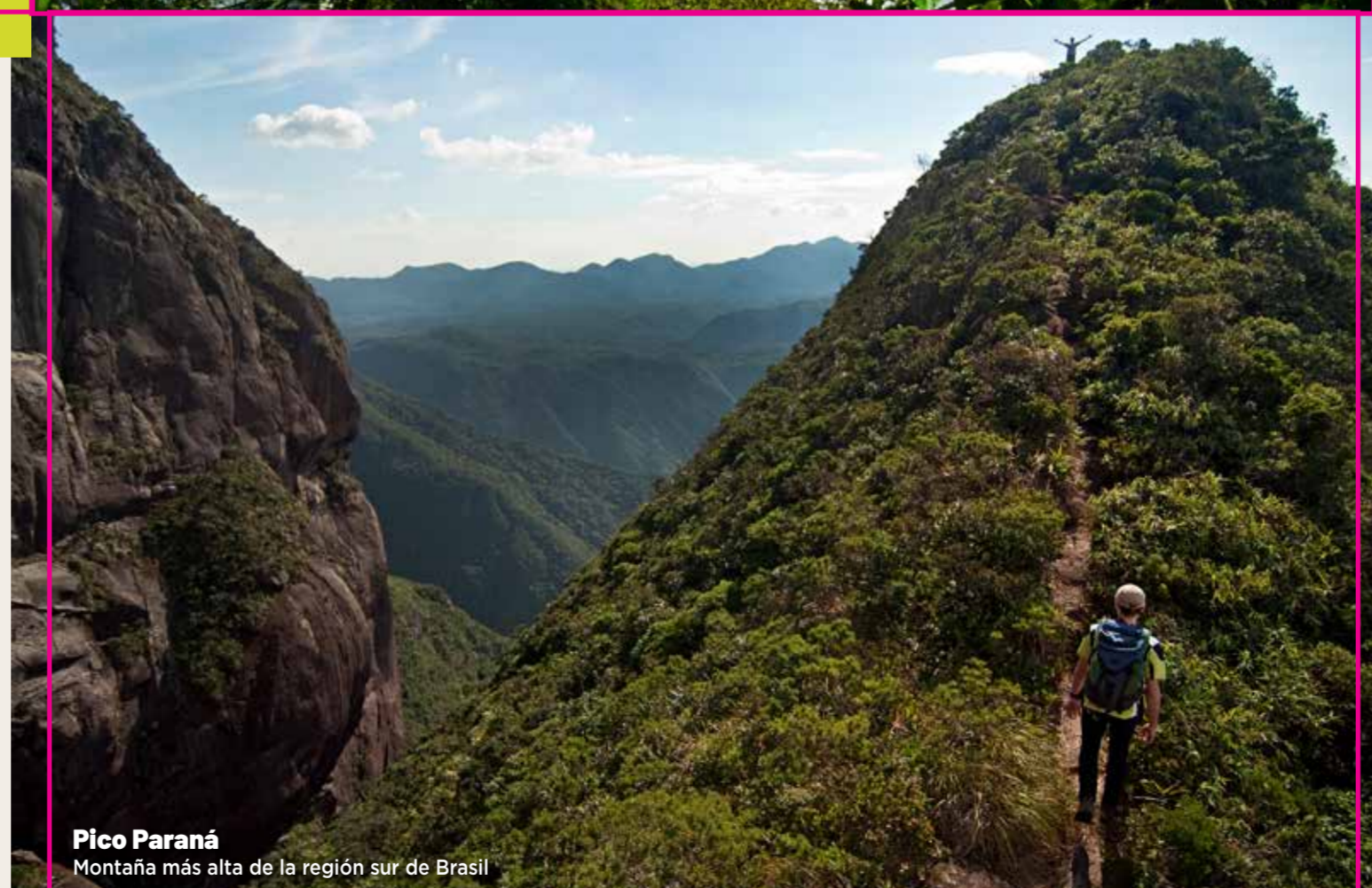
Pico Paraná Montaña más alta de la región sur de Brasil