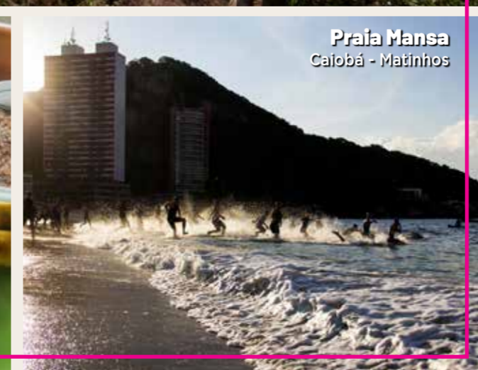
Praia Mansa Calobá - Matinhos