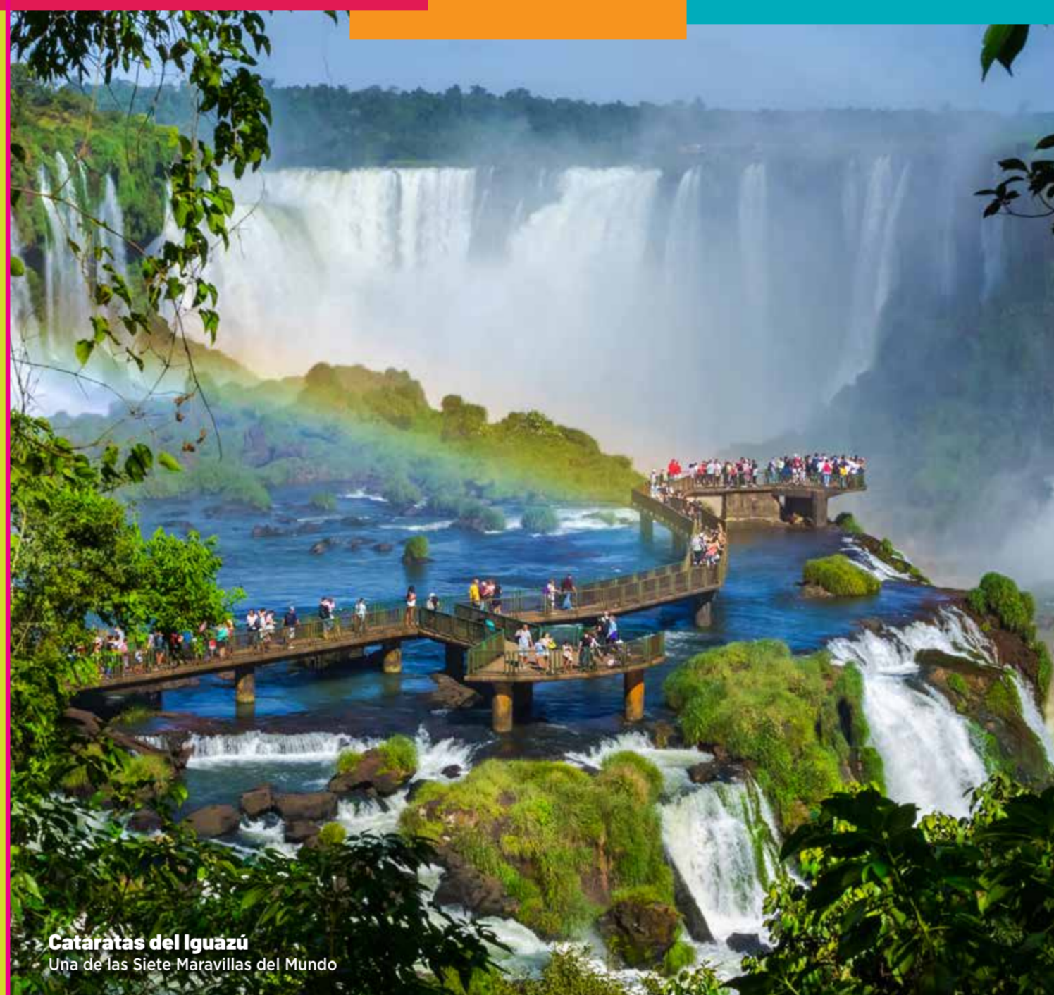
Cataratas del Iguazú Una de las Siete Maravillas del Mundo