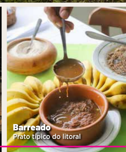
Barreado Prato típico do litoral