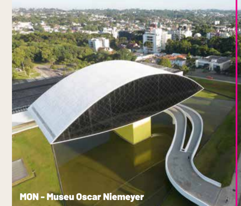
MON - Museu Oscar Niemeyer

Y hay mucho más para conocer y hacer en el estado. Son 399 comunas , con santuarios ecológicos, biodiversidad, destinos y programas bien estructurados.